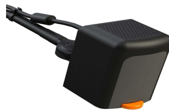
מצלמת קרוב רחוק